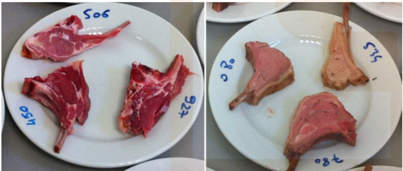
Figure 3 : Visuellement, les côtelettes d'agneaux de 80 jours (n°927 et n°780) sont plus proches de celles des agneaux lourds (n°450 et n°080) que de celles d'agneaux de 40 jours (n°506 et n°534)

Présentation de côtelettes d'agneau de 40 (n°506 et n°534), 80 (n°927 et n°780) et 150 jours (n°450 et n°080) crues (à gauche) et cuites (à droite)